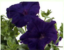
Blau _____ x 6 Stk.