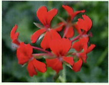
Rot _____ x 6 Stk.