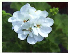
Weiß _____ x 6 Stk.