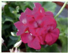
Pink _____ x 6 Stk.