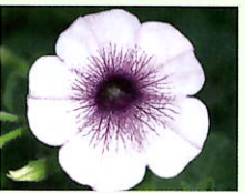
Weiß mit Auge _____ x 6 Stk.