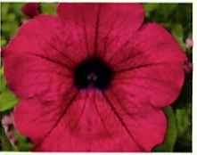
Dunkelpink _____ x 6 Stk.