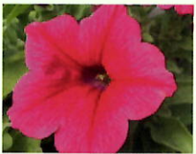
Pink _____ x 6 Stk.