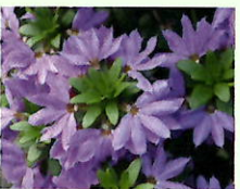
Fächerblume _____ x 6 Stk.