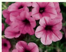
Rosa mit Auge _____ x 6 Stk.