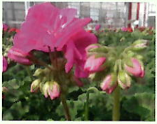
Pink _____ x 6 Stk.