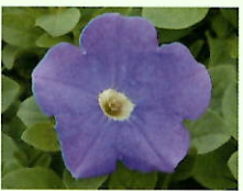
Hellblau _____ x 6 Stk.