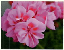
Rosa/rot _____ x 6 Stk.