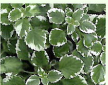
Weihrauch _____ x 6 Stk.