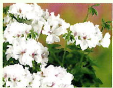
Weiß _____ x 6 Stk.