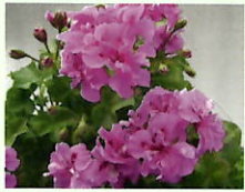
Lila _____ x 6 Stk.