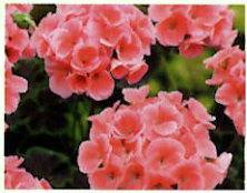
Lachs _____ x 6 Stk.