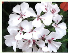
Weiß _____ x 6 Stk.