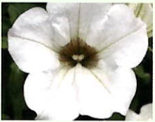
Weiß _____ x 6 Stk.