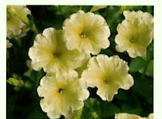
Gelb _____ x 6 Stk.