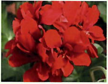
Rot _____ x 6 Stk.