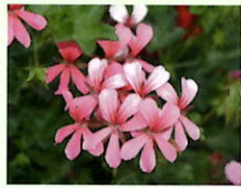
Rosa _____ x 6 Stk.