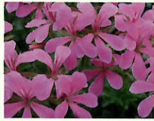
Lila/Pink _____ x 6 Stk.