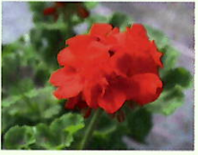
Rot _____ x 6 Stk.